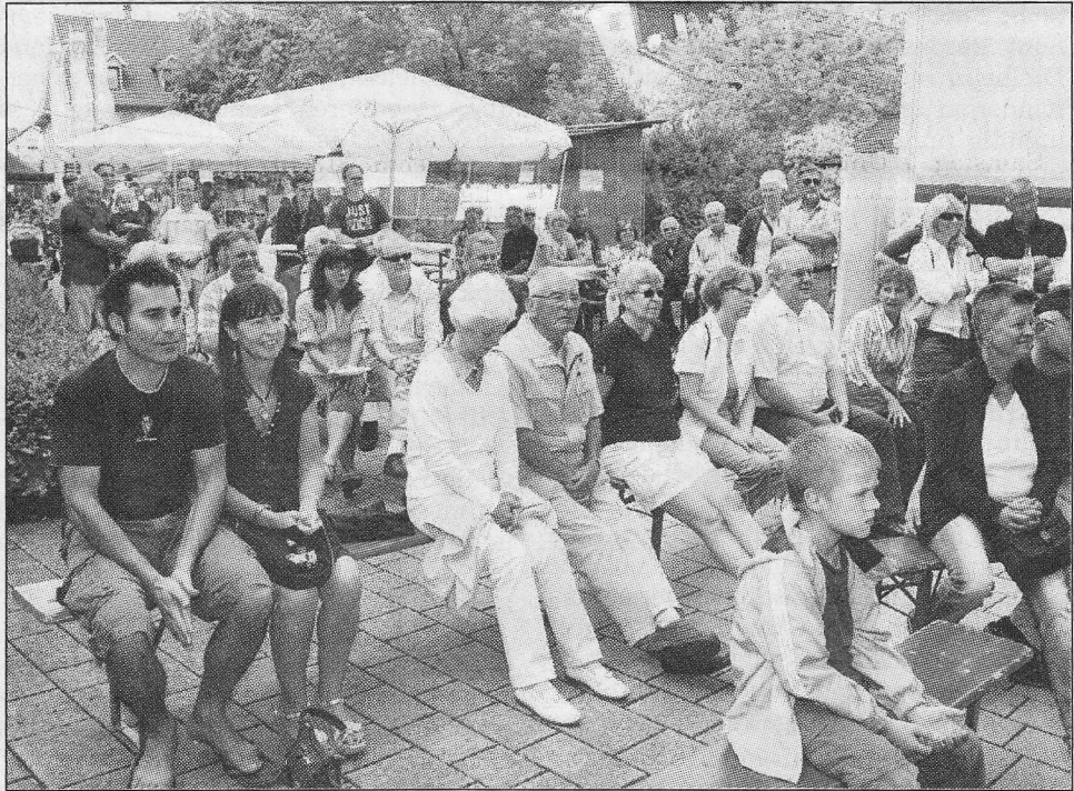
Die Mitarbeiter der Volksbank in Wiesloch wurden „Gemeinsam sozial aktiv“ und lockten mit ihren Aktion zahlreiche Besucher an.